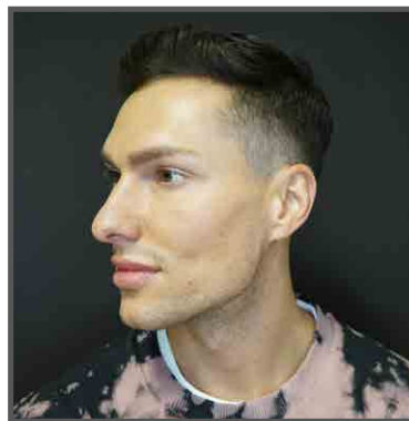
links vor der Unterspritzung